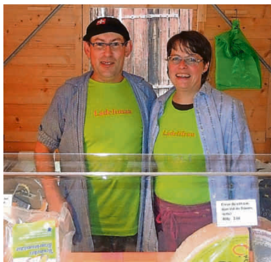
Die Lädelfrau hat auch einen Mann: neu sind sie am Fälländer Markt.

Morgen Samstag wird der Jodelclub Schwyzerhüsli Dübendorf dem Fälländer Markt seine Aufwartung machen. Er freut sich, mit Jodelliedern aus allen