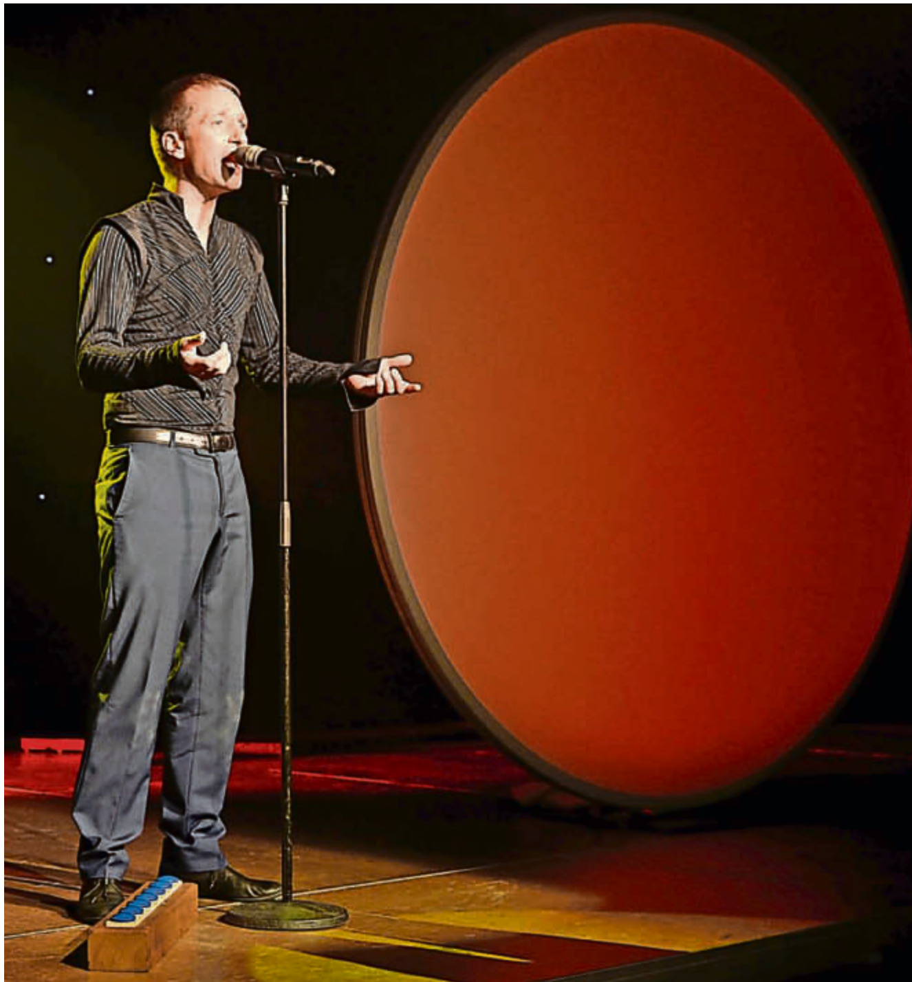
Stimmenkünstler Martin O. verblüffte und erstaunte das Publikum.

«Meine Programme basieren auf Beziehungen. So auch das Programm «Cosmophon». Wir Menschen stehen zu allem und jedem in irgendeiner Art Beziehung,